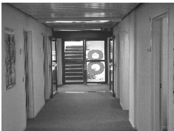
PBS fra cellekontorer til åbne kontorlandskaber