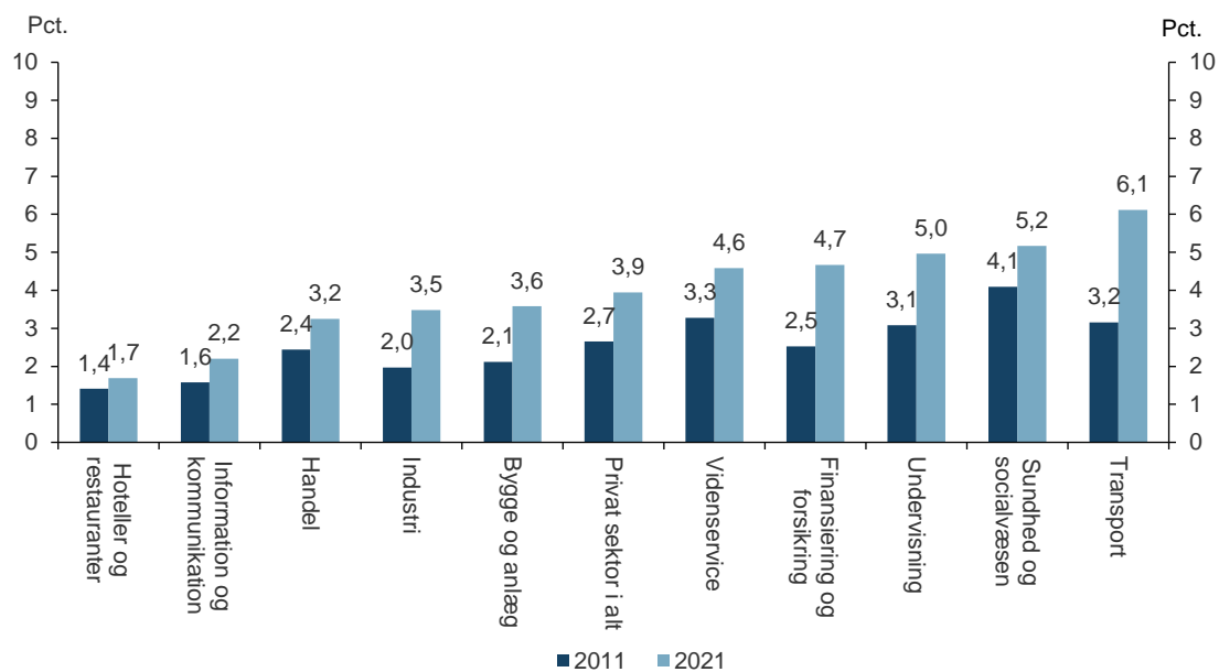
Figur 3. Andel af +65-årige i den private sektor i 3. kvartal 2011 og 3. kvartal 2021 i udvalgte brancher

Anm.: I opgørelsen den private sektor defineret, som lønmodtagere i private virksomheder, private non-profit organisationer og offentlige virksomheder, der opererer på markedsvilkår . De +65-årige i brancherne er sat i forhold til det samlede antal lønmodtagere i branchen eksklusiv lønmodtagere med uoplyst alder/ uden bopæl i Danmark..